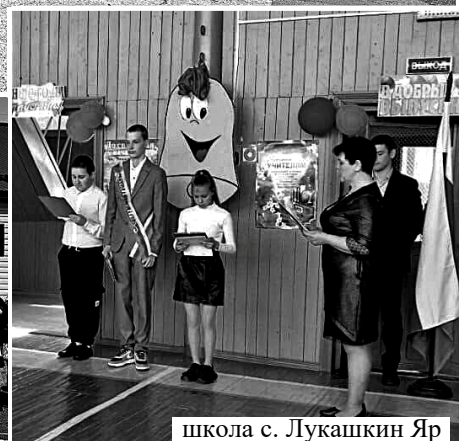
школа с. Лукашкин Яр