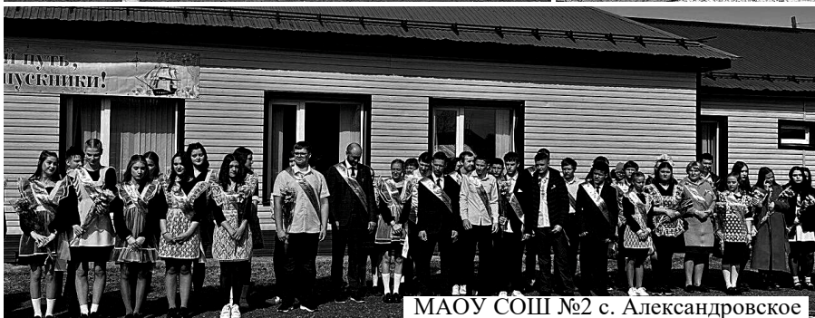
МАОУ СОШ №2 с. Александровское