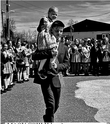
МАОУ СОШ №1 с. Александровское

Последний школьный звонок для сегодняшних одиннадцатиклассников и девятиклассников звенит, наверное, о том, что их воспоминания о школьной жизни будут одними из самых незабываемых.