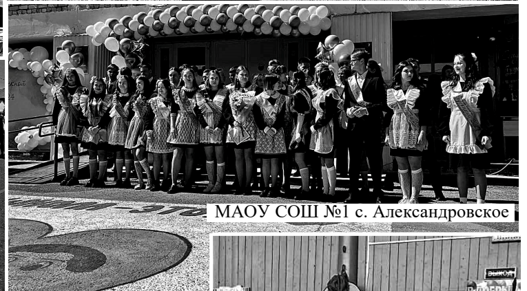
МАОУ СОШ №1 с. Александровское