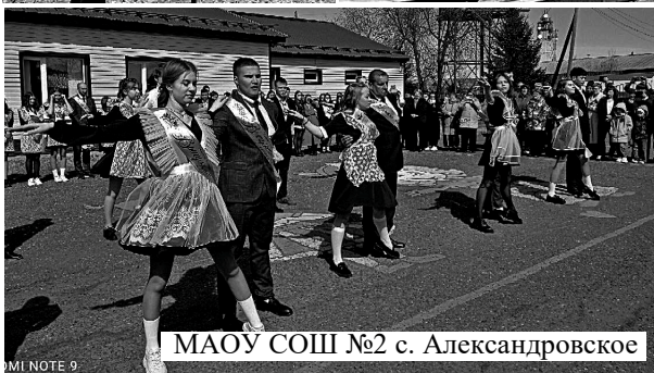
МАОУ СОШ №2 с. Александровское