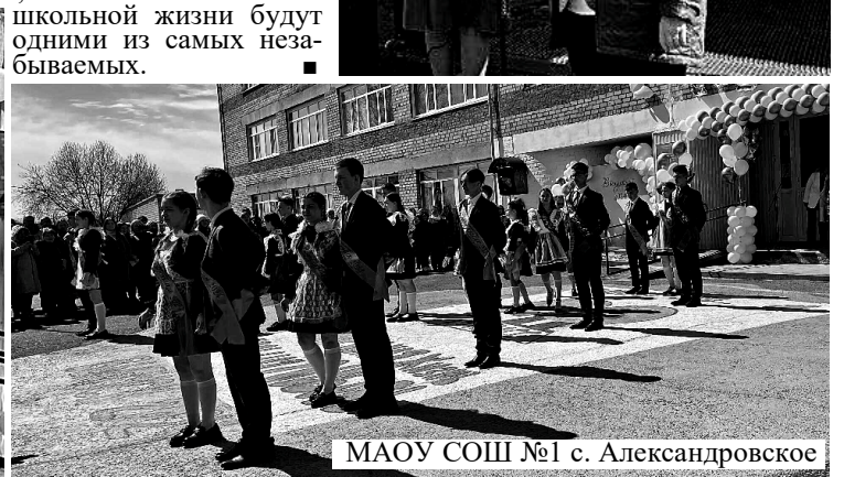
МАОУ СОШ №1 с. Александровское