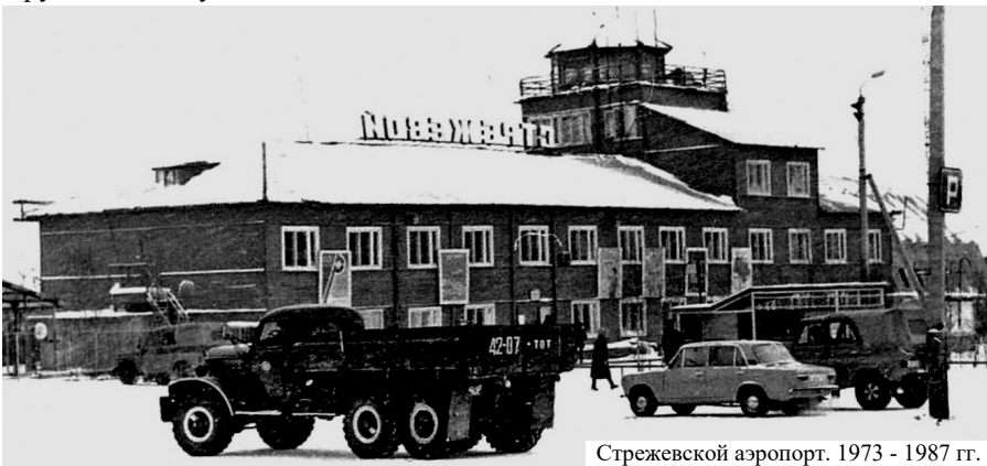
Стрежевской аэропорт. 1973 - 1987 гг.